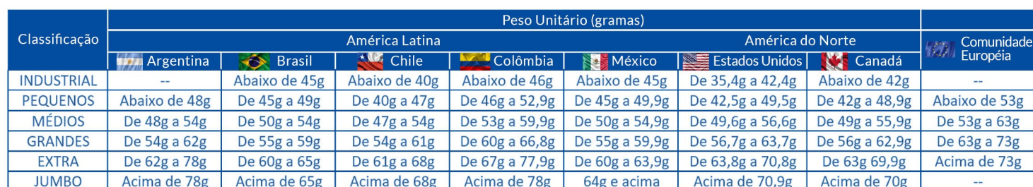
TABELA 1: FAIXAS DE PESO

A classificação dos ovos por peso varia de país para país. Confira abaixo alguns exemplos de classificação quando o ovo de mesa é vendido por peso.