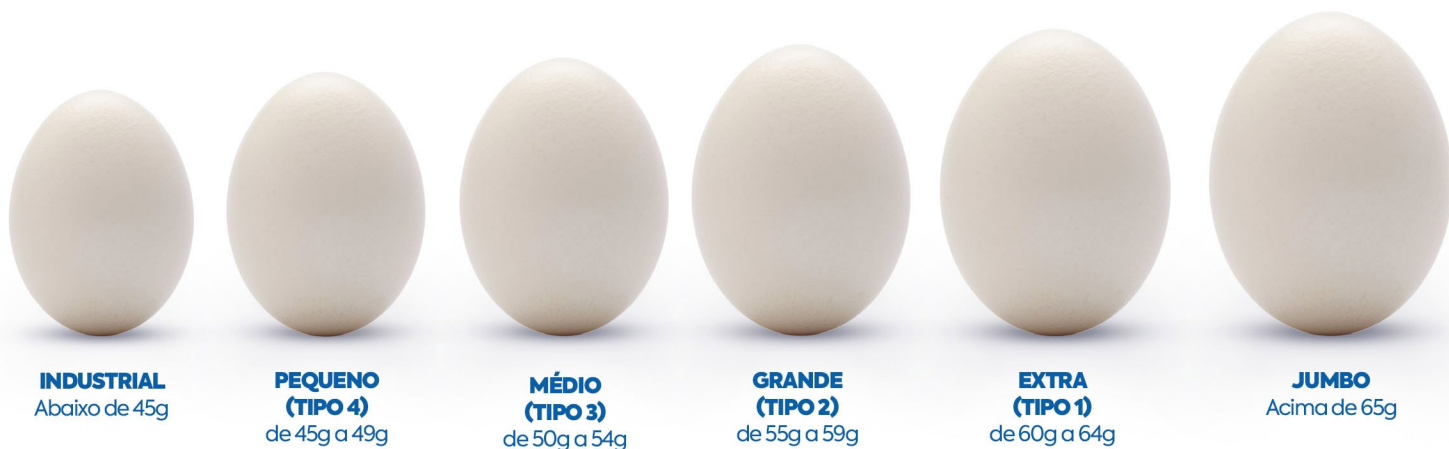
INDUSTRIAL Abaixo de 45g