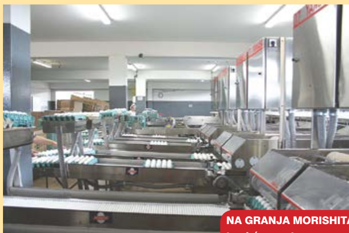
NA GRANJA MORISHITA, os equipamentos Yamasa também contam com o detector de fissuras