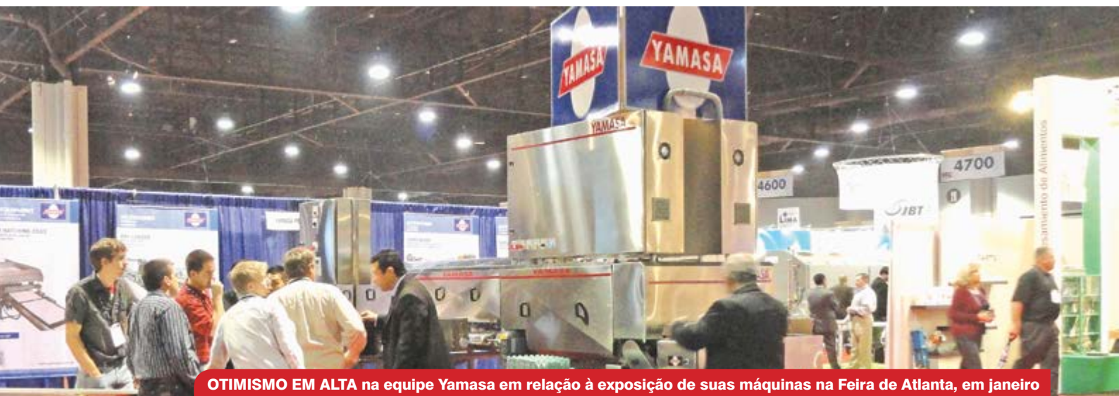
OTIMISMO EM ALTA na equipe Yamasa em relação à exposição de suas máquinas na Feira de Atlanta, em janeiro de 2014; estarão expostas a YHD-12 e a EOC-18.24, para incubatórios e ovos de codorna, respectivamente

na. Conquistando clientes em países como a Espanha, a França e a Rússia, a EOC-18.24 foi desenvolvida a pedido de clientes brasileiros, que sentiram a necessidade de tornar mais fácil a embalagem dos ovos.