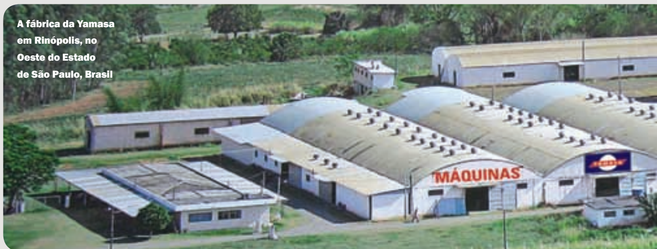
A fábrica da Yamasa em Rínópolis, no Oeste do Estado de São Paulo, Brasil