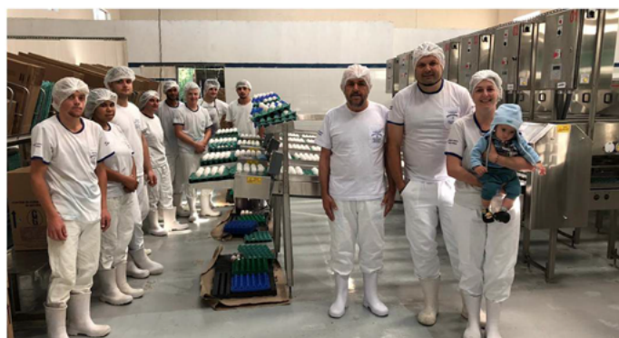
Família Guilherme: no comando da granja que é destaque no Espírito Santo.