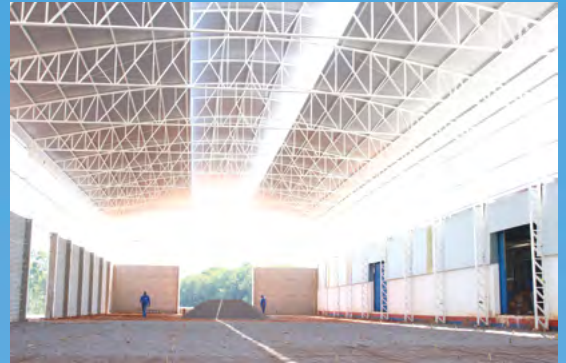
Novo galpão industrial está sendo preparado para receber a linha de produção dos equipamentos YHD para ovos férteis. O crescimento não pára na Indústria de Máquinas Yamasa, em Rinópolis (SP).