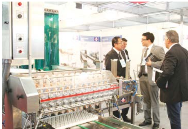
EQUIPAMENTO DA LINHA YHD FEZ GRANDE SUCESSO NO ESTANDE DA YAMASA durante o SIAV 2013, em São Paulo.

O estande nº 30 do SIAV 2013 representou um endereço de sucesso para a Indústria de Máquinas Yamasa, no final de agosto. Foi lá, no Salão Internacional de Avicultura, promovido pela Ubabef, em São Paulo, que a equipe Yamasa pôde apresentar, em primeira mão, as novidades da linha YHD-12, que possui máquinas classificadoras e embaladoras de ovos férteis.