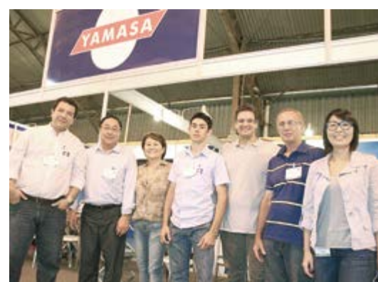
Na FESTA DO OVO, em Bastos