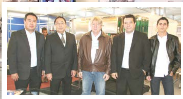
No SIAV, em São Paulo