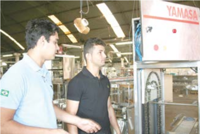
O TREINAMENTO NA FÁBRICA DA YAMASA tem sido uma experiência fundamental para funcionários que acompanham os equipamentos no cotidiano das granjas

naram e me estimularam a aprender”, ressalta.