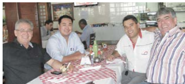
Na 2ª FAVESU, no Espírito Santo

Confira alguns flashes da equipe Yamasa nos eventos da avicultura.