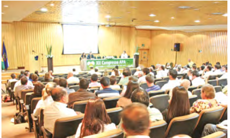
CONGRESSO DA APA, a Yamasa ao lado do avicultor de postura

Ao comemorar 50 anos de fundação, a Yamasa apresenta sua agenda de participação em eventos, reforçando a marca e estando ao lado do avicultor brasileiro e de outros países.