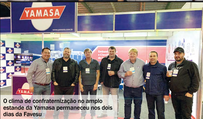
O clima de confraternização no amplo estande da Yamasa permaneceu nos dois dias da Favessu