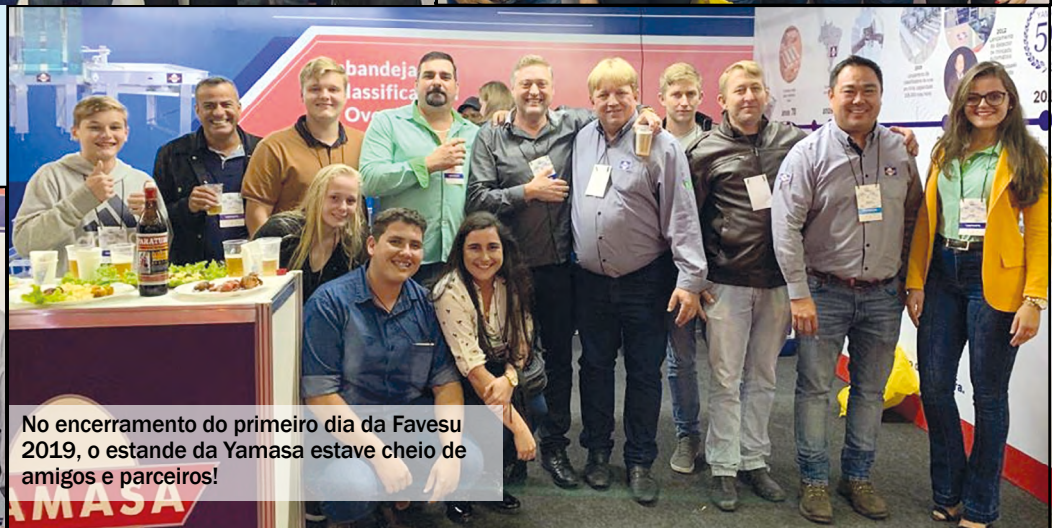
No encerramento do primeiro dia da Favesu 2019, o estande da Yamasa esteve cheio de amigos e parceiros!