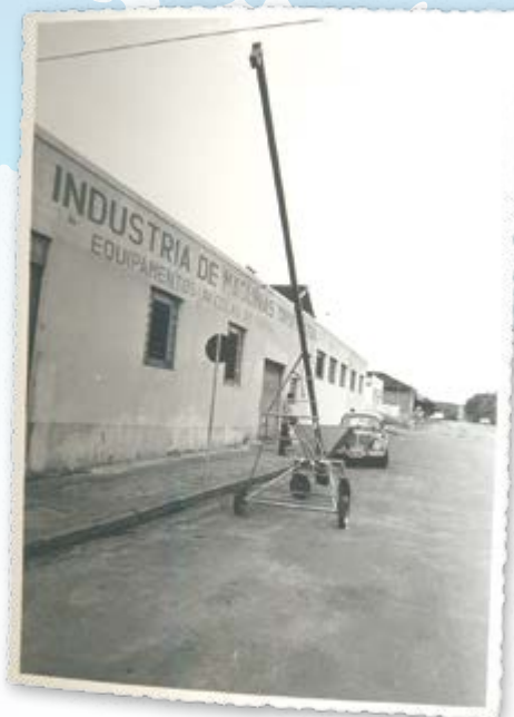
NA PRIMEIRA FÁBRICA, os primeiros equipamentos rumo à evolução