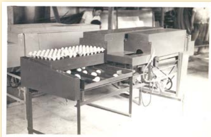
Na primeira fábrica, os primeiros equipamentos rumo à evolução

Empresa familiar fundada por el patriarca Yorio Yamazaki, Yamasa efectúa su transición al mundo globalizado con foco y responsabilidad.