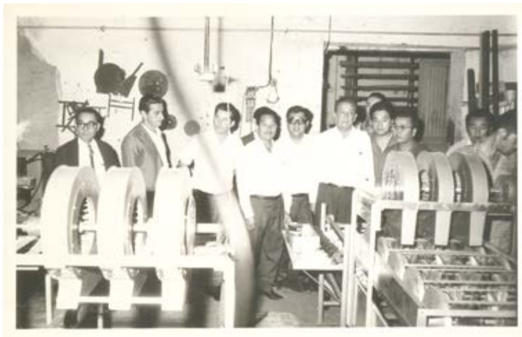
NA PRIMEIRA FÁBRICA, os primeiros equipamentos rumo à evolução