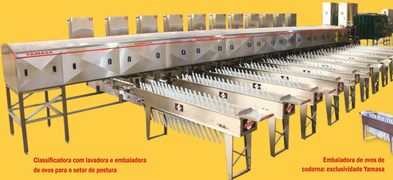
Classificadora com lavadora e embaladora de ovos para o setor de postura