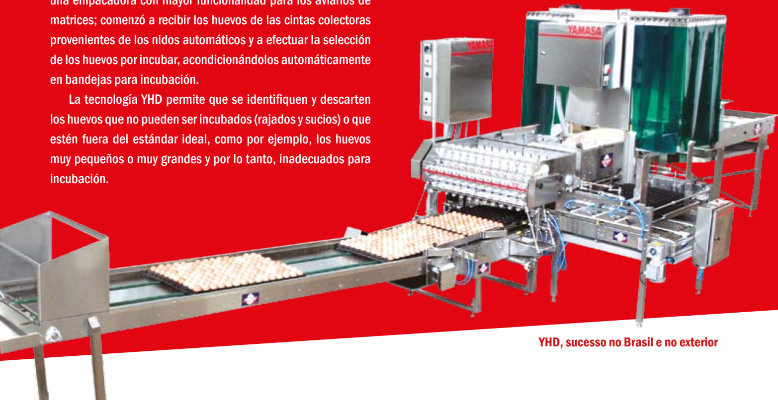
YHD, sucesso no Brasil e no exterior

La tecnología YHD permite que se identifiquen y descarten los huevos que no pueden ser incubados (rajados y sucios) o que estén fuera del estándar ideal, como por ejemplo, los huevos muy pequeños o muy grandes y por lo tanto, inadecuados para incubación.