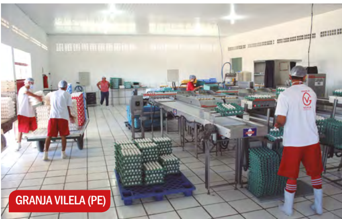
GRANJA VILELA (PE)

DE BASTOS (SP) A SÃO BENTO DO UNA (PE), a Yamasa marca presença em dois importantes polos da avicultura brasileira