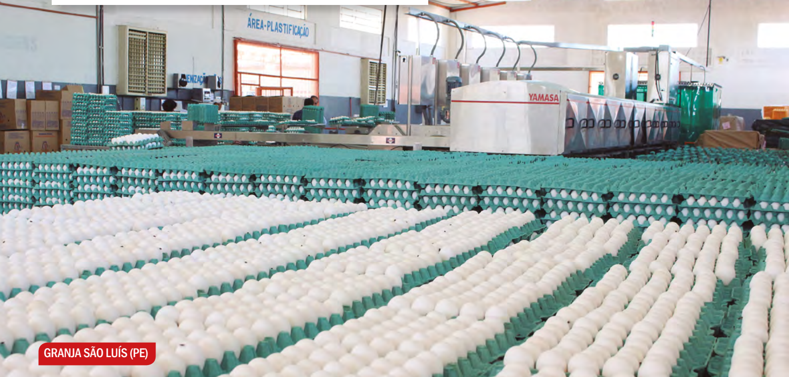
GRANJA SÃO LUÍS (PE)