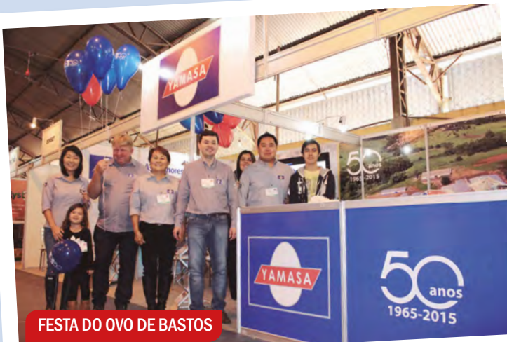
FESTA DO OVO DE BASTOS

DE BASTOS (SP) A SÃO BENTO DO UNA (PE), a Yamasa marca presença em dois importantes polos da avicultura brasileira