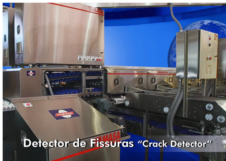
Detector de Fissuras "Crack Detector"

Apresenta a nota (nível) de trinca de cada ovo em tempo real. O operador pode determinar um nível de trinca diferente para cada categoria de ovo. Por exemplo, pode-se definir nível 5 de trinca para ovos pequenos e nível 3 de trinca para ovos extras. Trabalha com ovos brancos e ovos vermelhos.