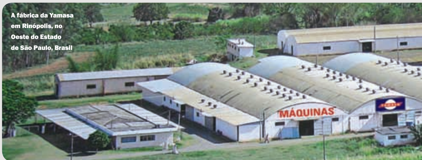
A fábrica da Yamasa em Rinópolis, no Oeste do Estado de São Paulo, Brasil