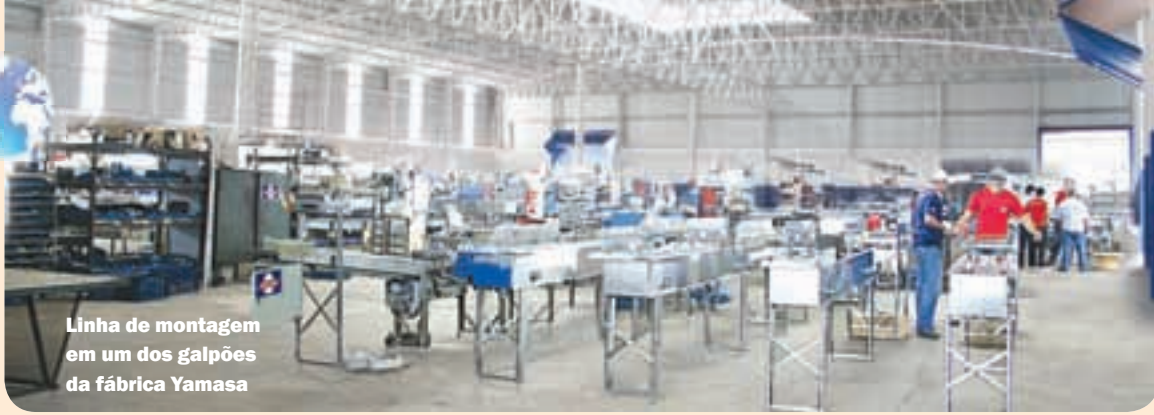
Linha de montagem em um dos galpões da fábrica Yamasa

brasileña descapitalizaron a Yamasa. La empresa vivió el riesgo de no sobrevivir a las tormentas económicas que asolaron Brasil. Como acostumbra acontecer con quien es serio, la crisis fue aprovechada para convertirse en oportunidad. “Mi hermano mayor me apoyó e indicó un consultor experimentado paulistano, que después de estudiar todas nuestras planillas financieras y estudiar nuestra producción, nos aconsejó que nos dediquemos solamente a los productos que eran de hecho nuestra vocación: clasificadoras y empacadoras de huevos. Tuvimos el buen criterio de oír el consejo profesional y volvimos a enfocarnos en nuestra vocación, lo cual, nos salvó de aquella crisis, saneando la empresa que volvió a tener ganancia y competitividad”.